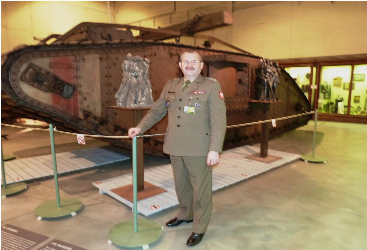
Muzeum wojenne (War Museum) w Brukseli – na zdjęciu brytyjski czołg z 1916r.

Po zakończeniu całodziennego sesji plenarnej, w drodze powrotnej z HQ NATO do hotelu, uczestnicy MWM CIOR mieli okazję zwiedzić brukselskie Muzeum Wojny i zapoznać się z jego historią oraz zobaczyć eksponaty.